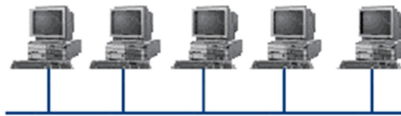
Топология компьютерной сети

В производственной практике ЛВС играют очень большую роль. Посредством ЛВС в систему объединяются персональные компьютеры, расположенные на многих удаленных рабочих местах, которые используют совместно оборудование, программные средства и информацию. Рабочие места сотрудников перестают быть изолированными и объединяются в единую систему.